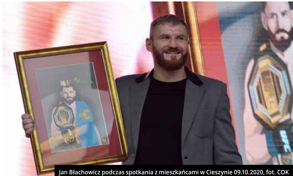
Jan Błachowicz podczas spotkania z mieszkańcami w Cieszynie 09.10.2020

Czy to zwycięstwo sprawi, że eksperci przyznają się do tego, że dotąd nie doceniali Cieszyńskiego Księcia i jego siły? Wszystko wskazuje na to, że tak. W takim tonie wypowiedział się np. Daniel Cormier, legenda świata UFC: – Czy Adesanya jest w stanie wygrywać z zawodnikami z kategorii półciężkiej? Oczywiście. Tego wieczoru po prostu nie mógł pokonać Błachowicza. Jan nie bez powodu jest mistrzem. Jest naprawdę dobry, silny, ma fantastyczne cardio i podbródek. Do tego jest pewny siebie, co uzupełnia wszystkie