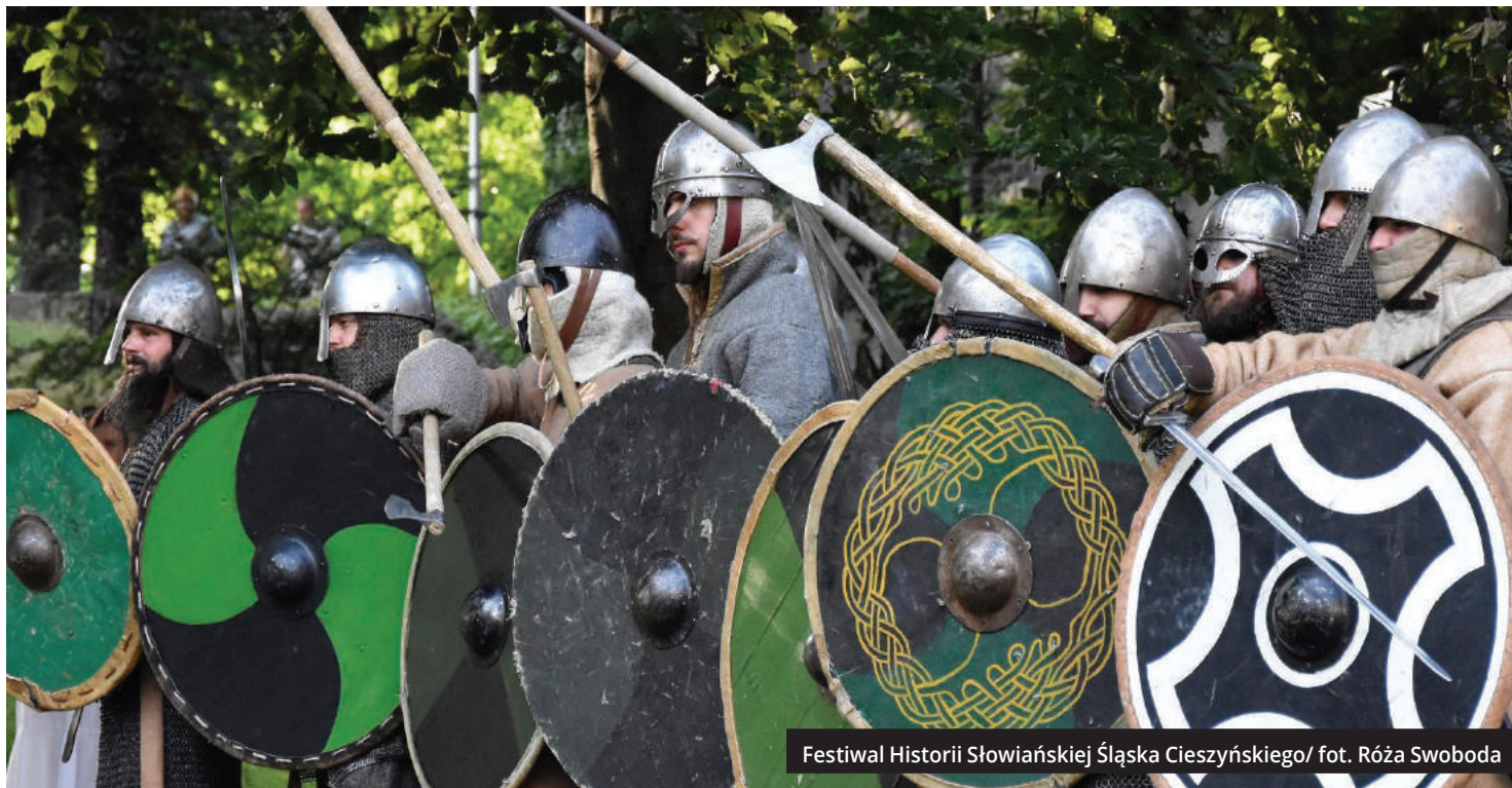
Festiwal Historii Słowiańskiej Śląska Cieszyńskiego