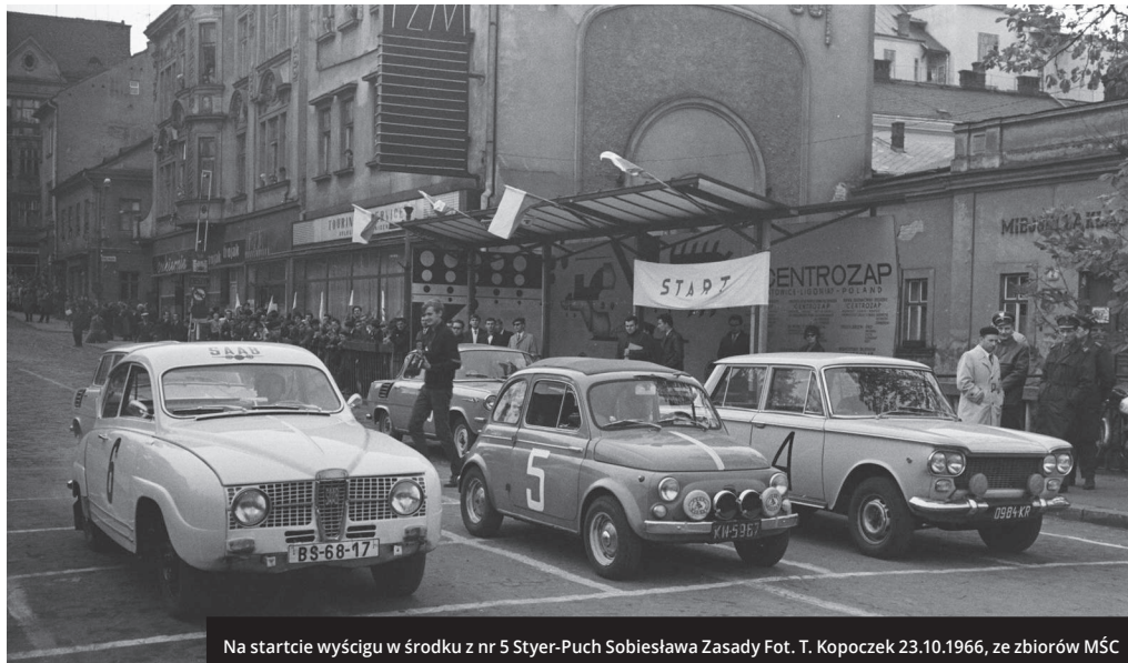
Na startcie wyścigu w środku z nr 5 Steyr-Puch Sobiesława Zasady 23.10.1966

Wyścigi motocyklowe organizowane były w Cieszynie już w okresie międzywojennym przez Motorowy Klub Związku Strzeleckiego pod hasłem „Popierając klub - zasilasz zmotoryzowane ramię Polski”. Ostatnie zawody przed wybuchem II wojny światowej rozegrano w czerwcu 1939 roku. Powrócono do tej tradycji w roku 1958, przy czym trzy lata później do rywalizacji motocykli dołączyły samochody sportowe.