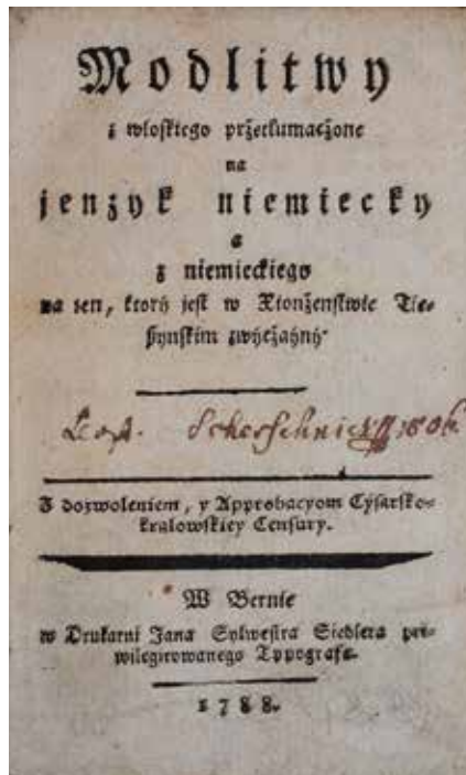
❷ KSIĄŻNICA CIESZYŃSKA

Ten niezwykle rzadki modlitewnik nosi dziś ślady dość intensywnego użytkowania. Zniszczone krawędzie ostatnich kart dzieła i przytwierdzone bezpośrednio do bloku książki grzbietowe naklejki, zawierające skrócony tytuł i sygnaturę, świadczą o braku oprawy już w XIX w. Wtedy bowiem książeczka znalazła się w zbiorach Biblioteki Leopolda Jana Szersznika, o czym informuje pozostawiony przez niego na karcie tytułowej druku podpis i data 1806. O rzadkości dzieła świadczy również fakt, że podczas jego poszukiwań w katalogach online bibliotek polskich i obcych,