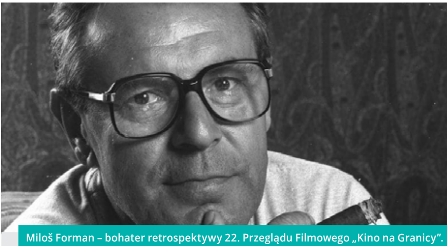
Miloš Forman – bohater retrospektywy 22. Przeglądu Filmowego „Kino na Granicy”.

Przegląd Filmowy „Kino na Granicy” rozpoczyna ogłaszanie programu. Bohaterem pierwszej retrospektywy będzie Miloš Forman – słynny czeski reżyser, twórca filmów „Lot na kukułczym gniazdem” i „Amadeusz”, laureat dwóch Oscarów i trzech Złotych Globów. Rusza także sprzedaż akredytacji na tegoroczną edycję przeglądu, która odbędzie się w dniach 1-6 maja w Cieszynie i Czeskim Cieszynie .