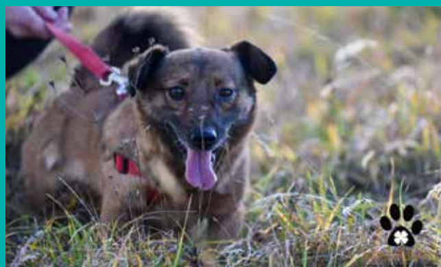
FUNDACJA „LEPSZY ŚWIAT”

Pod opieką Fundacji „Lepszy Świat” znajduje się dużo psów i kotów, które czekają na nowy, kochający dom.