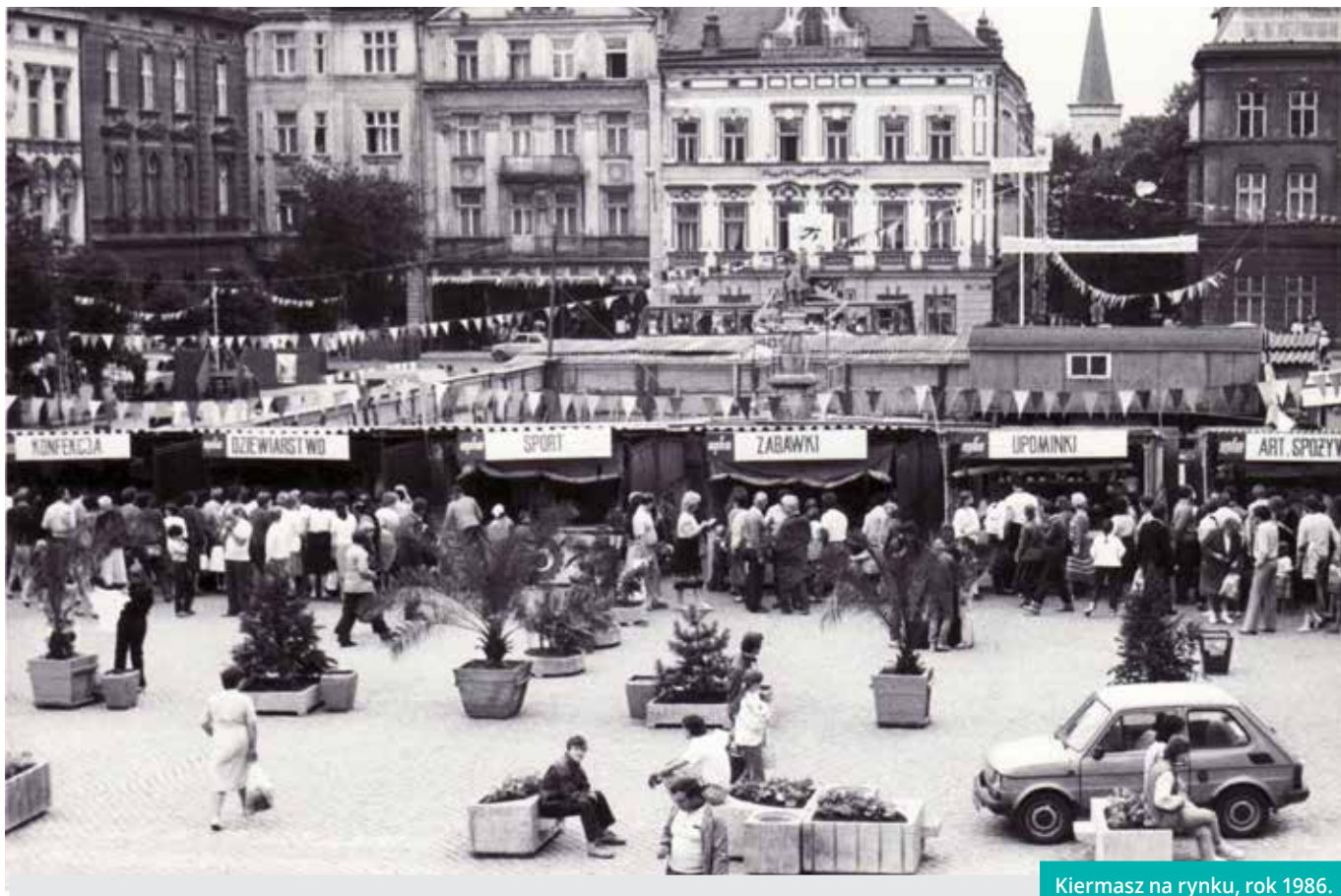
Kiermasz na rynku, rok 1986.

W latach 80. obok bieżącej działalności w sekcjach i kursach, działalność CCK skupiała się na prezentacji dorobku lokalnych twórców i artystów. Organizowano wystawy i spotkania autorskie, koncerty muzyki poważnej i rozrywkowej a do 1983 roku odbywały się także Cieszyńskie Spotkania Małych Form „Temafor” (od 1975 roku). Imprezami masowymi były Dni Majowe i Karnawał Lipcowy, jednak ze względu na zawirowania polityczne i gospodarcze zbyt wielu tego typu przedsięwzięć nie podejmowano. Skupiano się bardziej na