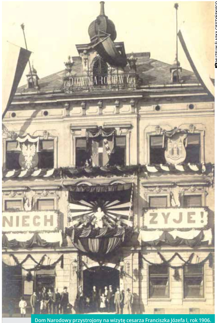
Dom Narodowy przystrojony na wizytę cesarza Franciszka Józefa I, rok 1906.

I wojna światowa nieco zahamowała rozwój działalności kulturalnej Domu Polskiego, ale mimo wojennej rzeczywistości w latach 1914-18 w jego wnętrzu nadal odbywały się wydarzenia kulturalne, takie jak przedstawienia teatralne, wieczorki upamiętniające polskie wydarzenia i postacie historyczne oraz wieczory