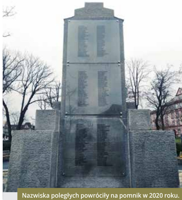
Nazwiska poległych powróciły na pomnik w 2020 roku.

IRENA FRENCH, MUZEUM ŚLĄSKA CIESZYŃSKIEGO ZDJĘCIE W TLE ZE ZBIORÓW MŚC – PROJEKT PRZEBUDOWY POMNIKA FJI, LATA 20. XX W