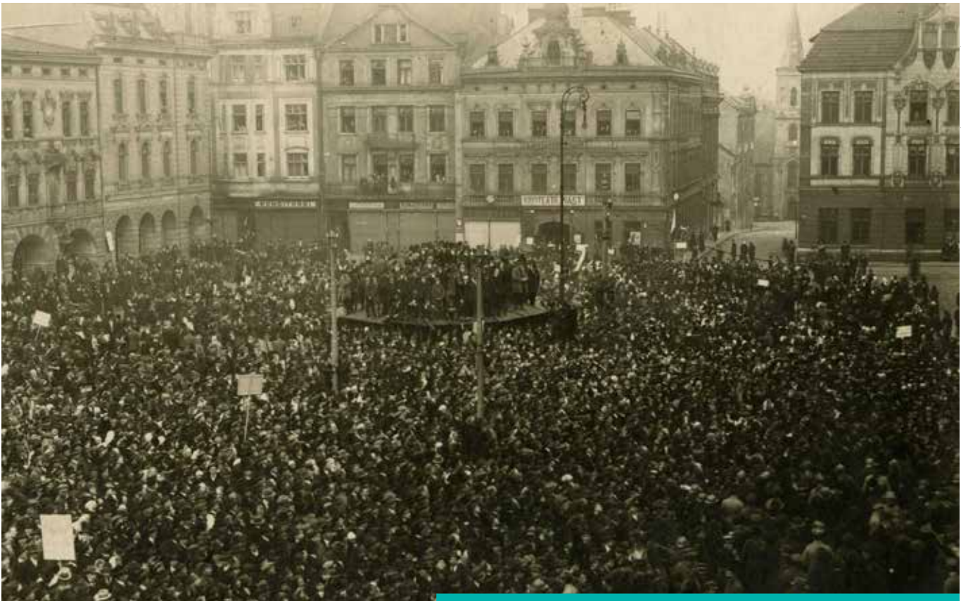
Wiec polski na rynku w czasie przygotowań do plebiscytu, 22 lutego 1920.

poetyckie i muzyczne. W okresie wojny działalność społeczno-kulturowa ośrodka kładła duży akcent na edukację i wychowanie narodowe. Celem tych działań było rozbudzenie świadomości narodowej, jej utrwalenie oraz przybliżenie polskiego dziedzictwa kulturowego. Do tego doszły pierwiastki wychowania patriotycznego. Trend ten dominował aż do zakończenia działań wojennych.