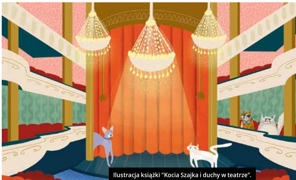
Ilustracja książki "Kocia Szajka i duchy w teatrze".