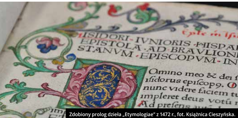
Zdobiony prolog dzieła „Etymologiae” z 1472 r.