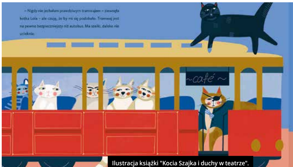
Ilustracja książki "Kocia Szajka i duchy w teatrze".