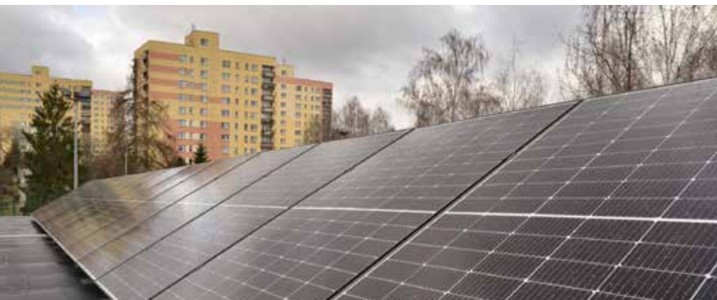
Instalacja fotowoltaiczna w Szkole Podstawowej nr 2 z Oddziałami Integracyjnymi, im. 4PSP.

Na bieżąco będziemy informować zarówno o toczących się pracach, jak i rozpoczynających się realizacjach kolejnych inwestycji. ♦