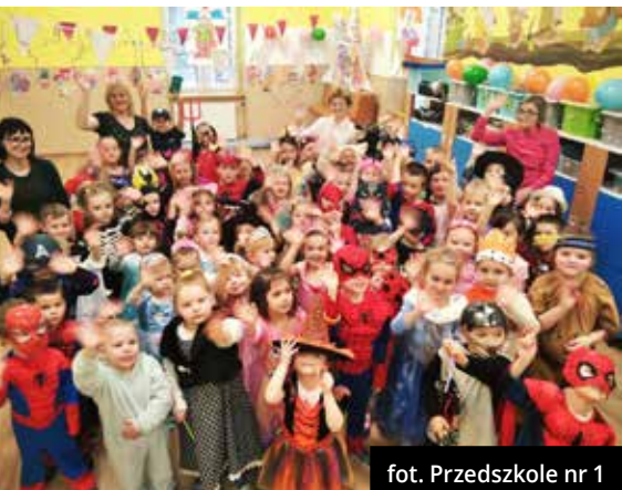
fol. Przedszkole nr 1

Placówka mieści się w zabytkowej kamienicy z 1899 roku, w ścisłym centrum miasta. Przedszkole powstało w 1953 roku, gdy ówczesna właścicielka budynku przekazała kamienicę, by służyła ona dzieciom. Instytucja czynna jest od poniedziałku do piątku w godzinach 6:30-16:30, znajduje się przy niej parking.