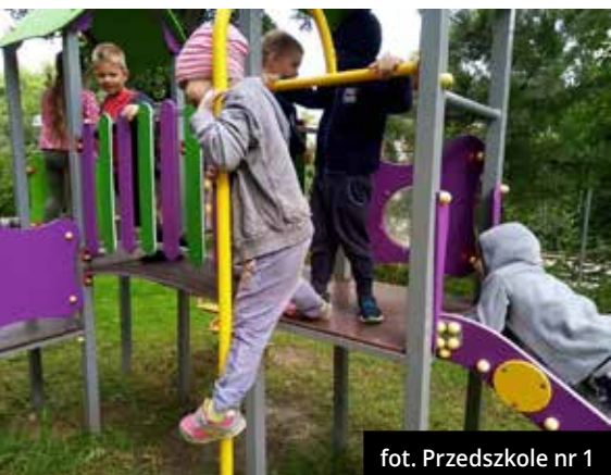
fol. Przedszkole nr 1

W przedszkolu pracuje wysoko wykwalifikowana kadra pedagogiczna, posiadająca duże doświadczenie zawodowe i pedagogiczne. Nauczyciele pracują w opar-