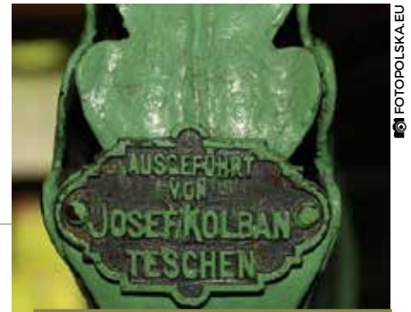
Detal balustrady z nazwiskiem autora.