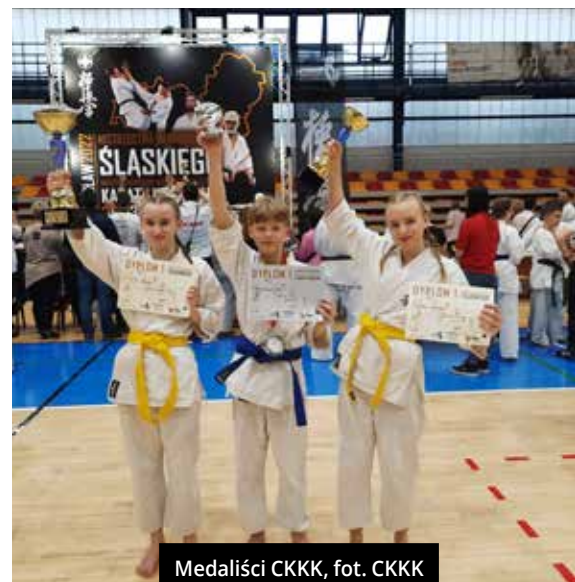
Medaliści CKKK