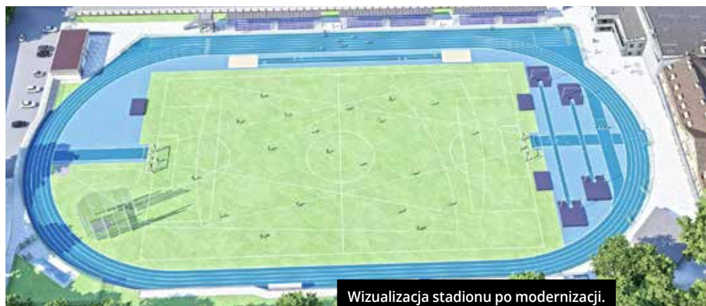
Wizualizacja stadionu po modernizacji.