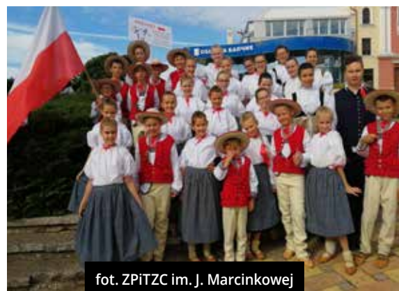
fort. ZPiTŻC im. J. Marcinkowej