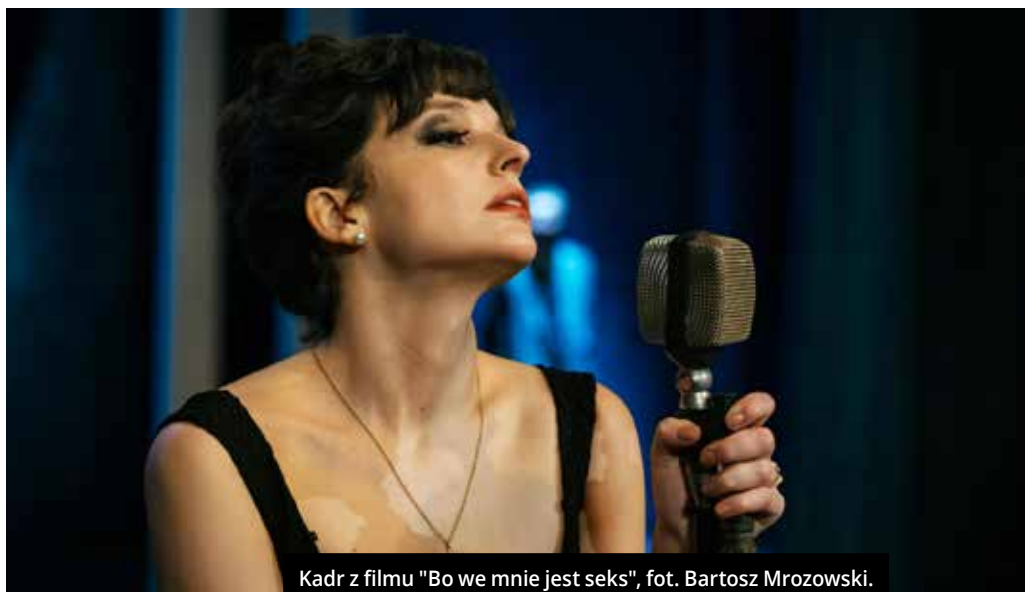
Kadr z filmu „Bo we mnie jest seks”, fot. Bartosz Mrozowski.