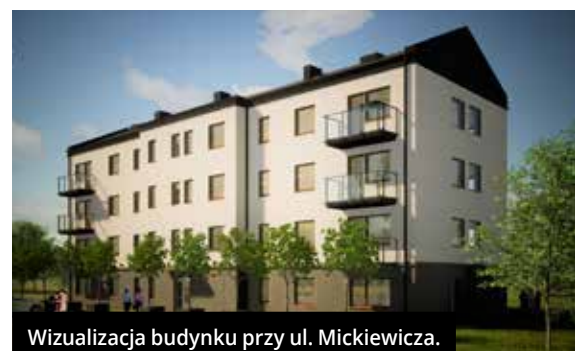
Wizualizacja budynku przy ul. Mickiewicza.