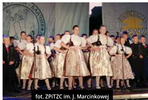
fort. ZPiTŻC im. J. Marcinkowej