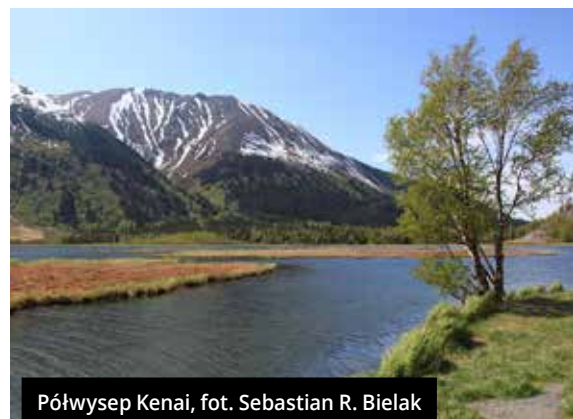
Półwysp Kenai