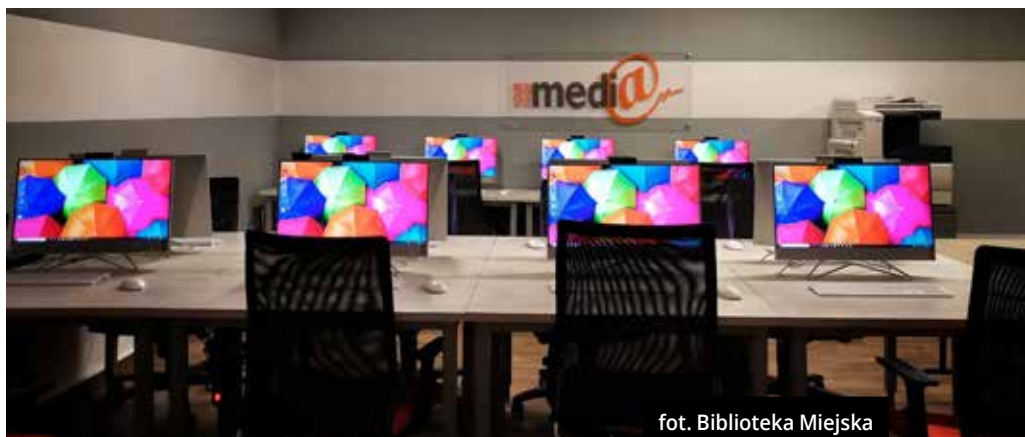
fol. Biblioteka Miejska