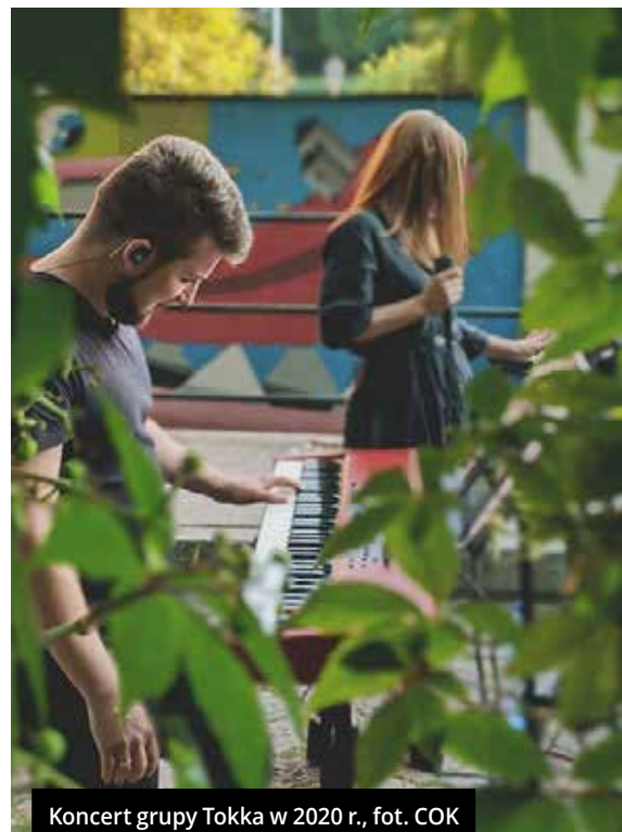
Koncert grupy Tokka w 2020 r.

Tegoroczną edycję organizatorzy chcieli by zadedykować najjaśniejszym gwiazdom filmowego nieba, które w wielu przypadkach wykraczają poza ramy kina środkowoeuropejskiego. Niektóre nazwiska już stały się legendami, a blask ich talentu promieniuje z ich filmów do dziś. Należy do nich niewątpliwie Miłoś Forman, którego fani kinematografii zapewne dobrze znają. W Cieszynie widzowie będą mieli