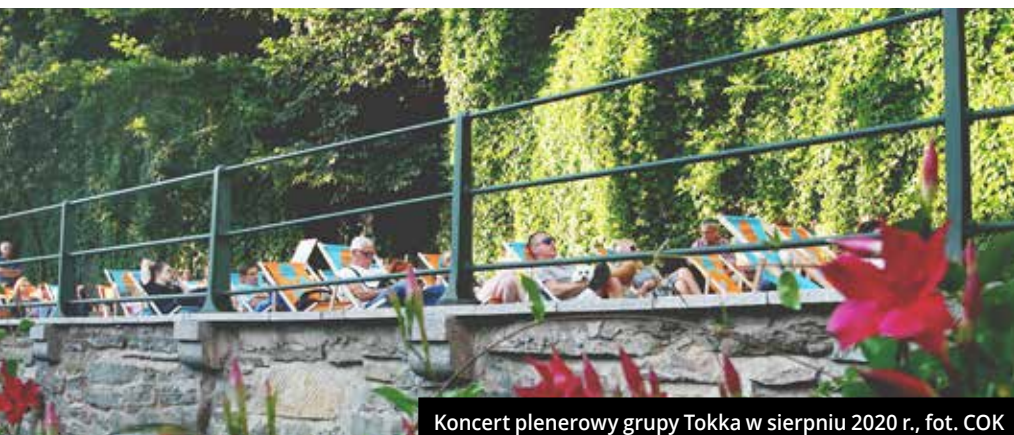
Koncert plenerowy grupy Tokka w sierpniu 2020 r.

Zapraszam do korzystania z oferty cieszynskich restauracji i kawiarni – większość otworzyła ogródki letnie. Mamy nadzieję na ciepłe i słoneczne wakacje, tym bardziej, że w Cieszynie można ten czas spędzić aktywnie i przyjemnie, o czym przekonujemy na kolejnych stronach Wiadomości Ratuszowych. Nie zapominajmy jednak o tym, byśmy wszyscy czuli się w swoim towarzystwie komfortowo i bezpiecznie. ♦