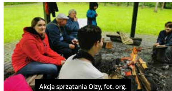
Akcja sprzątania Olzy