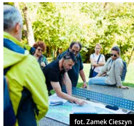
fort. Zamek Cieszyn