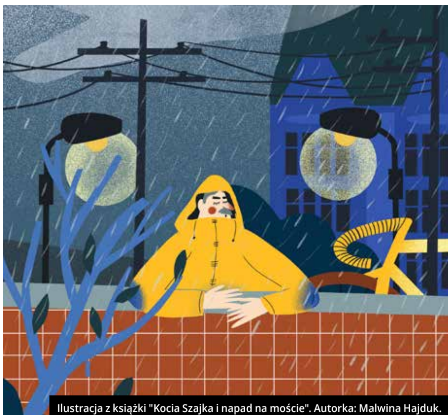
Ilustracja z książki "Kocia Szajka i napad na moście". Autorka: Malwina Hajduk.