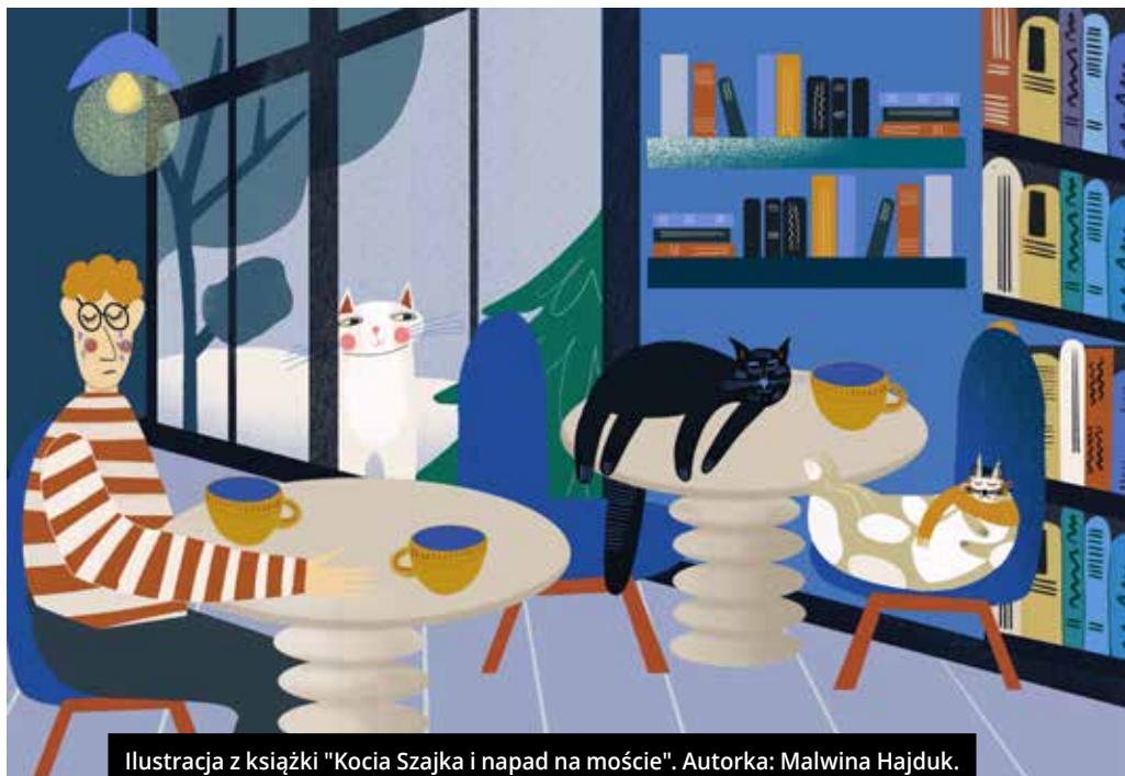
Ilustracja z książki "Kocia Szajka i napad na moście". Autorka: Malwina Hajduk.

gwarowych. Czy Bronka powinna mówić „poczkej” czy „doczkej”? Bo przecież oba się bronią w zdaniu „Poczkej/doczkej na oma, łona ci fszysko powiy”. Ale trzeba dokonać wyboru. Czy spadając z wyciągu narciarskiego w Wiśle, powinna krzyczeć „jezderkusie” czy „jezeryny”? Dylematom nie ma końca, ale nie chodzi o to, żeby prowadzić akademicką dyskusję i radzić się językoznawców. Ja pytam cieszyńiaków: czy tak mówicie w domu? Czy tak powiedziałyby twoja mama? I jak słyszę: „mosz recht” to już wiem, że jest dobrze.