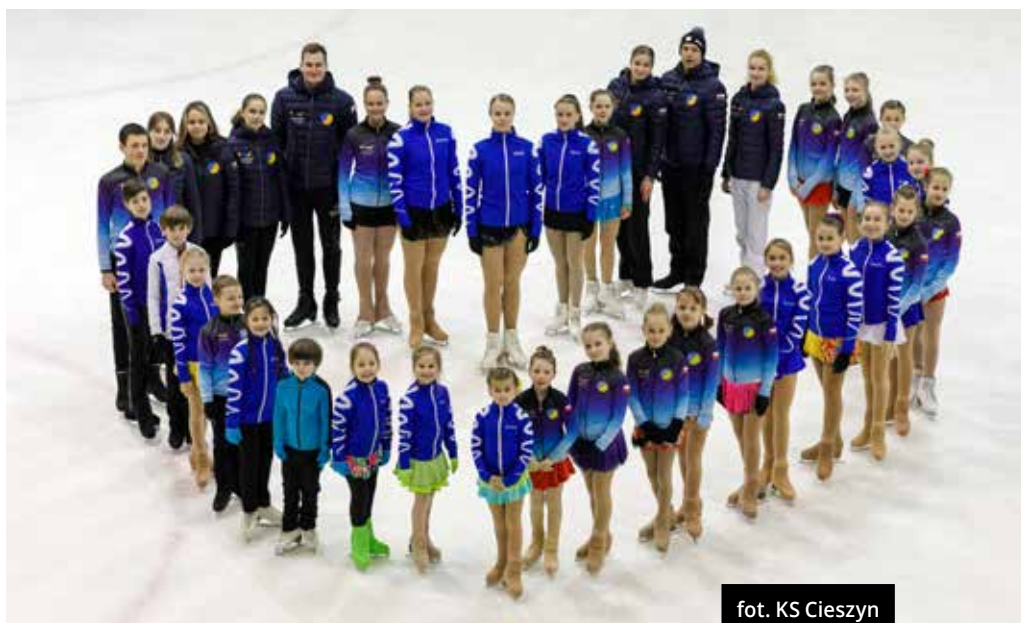
fol. KS Cieszyn

Obecna kadra trenerska KS Cieszyn to byli zawodnicy. Można powiedzieć, że pandemiczny sezon 2020/2021 okazał się sportowo najlepszy w dotychczasowej historii klubu. Nasi zawodnicy wzięli udział