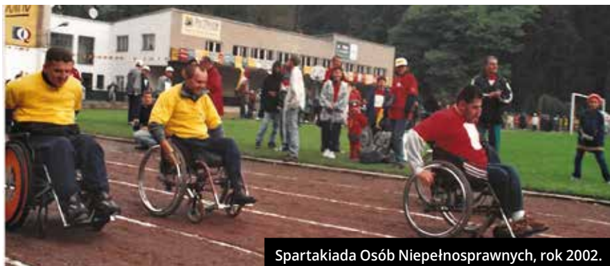
Spartakiada Osób Niepełnosprawnych, rok 2002.

W każdym społeczeństwie są ludzie o różnej sprawności. Podobnie jest w naszym mieście. Osoby z niepełnosprawnościami to ludzie poszkodowani nie tylko przez los, ale także przez otoczenie. 25 lat temu, w listopadzie 1996 roku, grupa aktywistów postanowiła to zmienić. W ten sposób rozpoczęła się nasza mała historia.