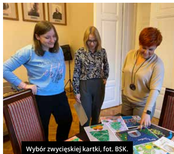
Wybór zwycięskiej kartki, fot. BSK.