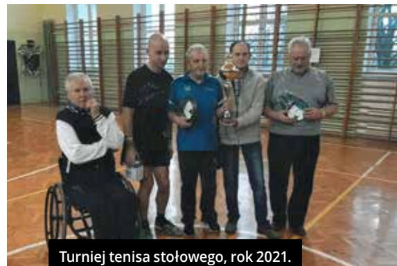
Turniej tenisa stołowego, rok 2021.