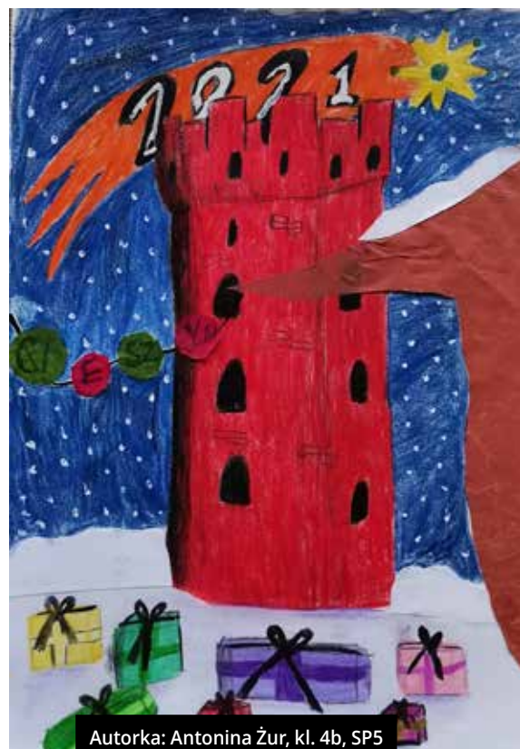
Autorka: Antonina Żur, kl. 4b, SP5