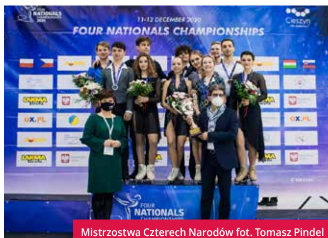
Mistrzostwa Czterech Narodów