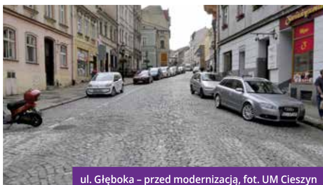
ul. Głęboka – przed modernizacją