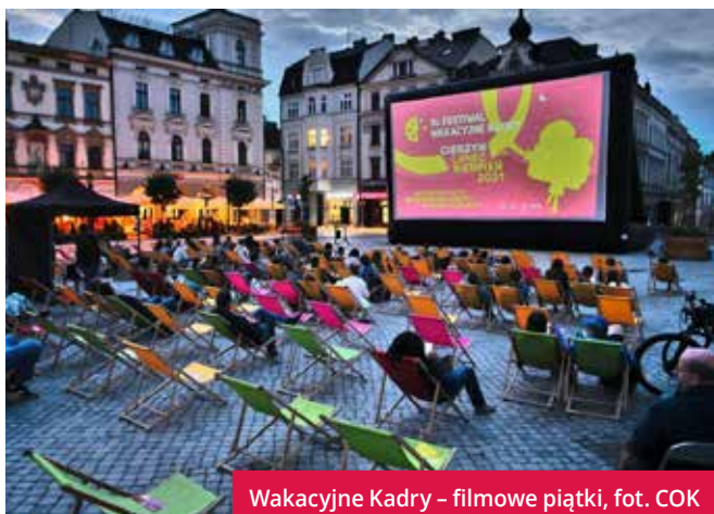
Wakacyjne Kadry – filmowe piątki

Głównym celem wydarzeń o lokalnym zasięgu jest integracja mieszkańców Cieszyna, okolicznych miejscowości, a przede wszystkim – dobra zabawa. Czy tak rzeczywiście jest? Jak najbardziej!