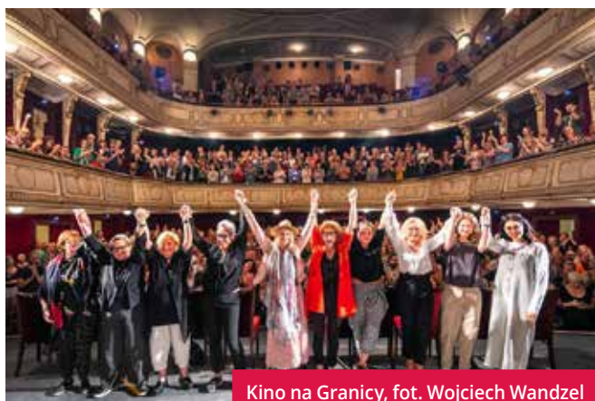
Kino na Granicy

Wychodząc naprzeciw potrzebom mieszkańców i turystów, miasto współfinansuje liczne wydarzenia i imprezy, które stanowią o jego dynamicznym rozwoju, ale również służą promocji życia kulturalnego. Ponadto za sprawą licznych koncertów, festiwali, oferuje także niewątpliwą szansę przyciągnięcia szerokiego grona turystów.