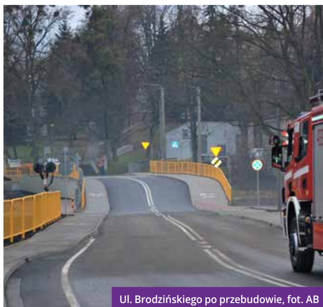
Ul. Brodzińskiego po przebudowie