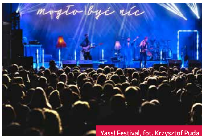
Yass! Festival