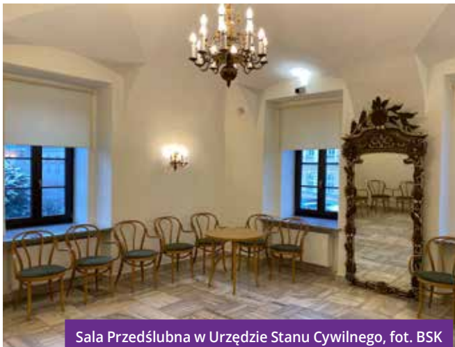
Sala Przedślubna w Urzędzie Stanu Cywilnego