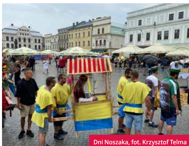
Dni Noszaka