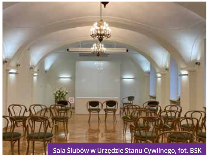
Sala Ślubów w Urzędzie Stanu Cywilnego

Kompleksowa modernizacja budynku administracyjnego Kochanowskiego 14 to nie tylko poprawa jakości i warunków pracy, ale również nowoczesne wnętrza, które sprawia, że jeden z najważniejszych dni w życiu młodej pary nabiera bardziej uroczystego charakteru.