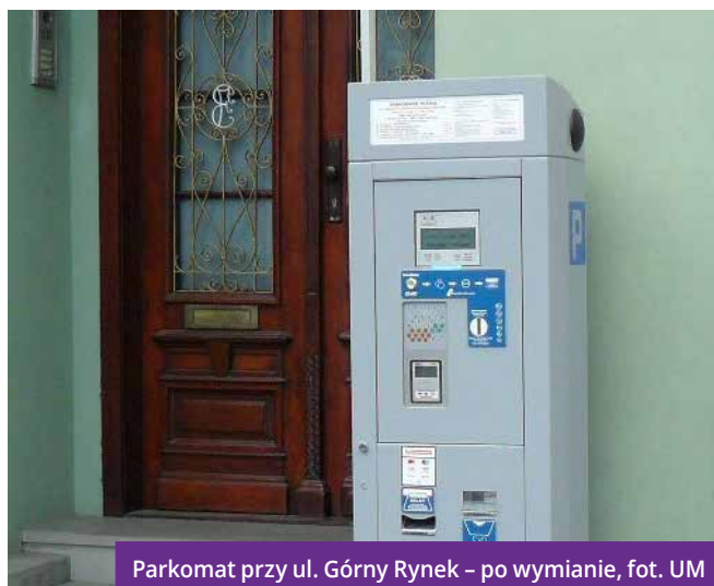
Parkomat przy ul. Górny Rynek – po wymianie, fot. UM