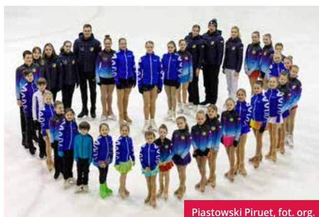
Piastowski Piruet