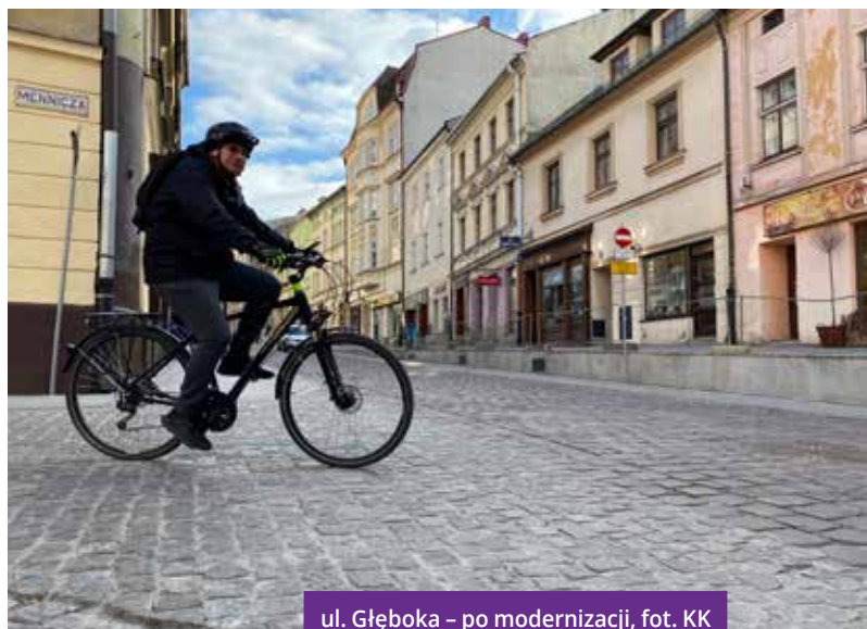
ul. Głęboka – po modernizacji