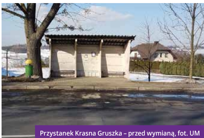
Przystanek Krasna Gruszka – przed wymianą

Wymienione zostały również stare i zniszczone parkometry w strefie płatnego parkowania na nowe w ilości 29 szt. Nowe parkometry posiadają możliwość płatności gotówką, kartą oraz aplikacjami mobilnymi, np. za pomocą aplikacji MoBilet. Koszt wymiany 29 parkomatów wyniósł 429 270 zł. ♦