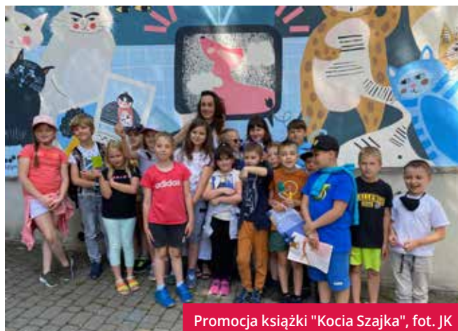
Promocja książki "Kocia Szajka"