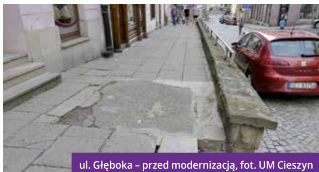
ul. Głęboka – przed modernizacją