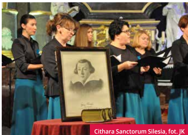
Cithara Sanctorum Silesia