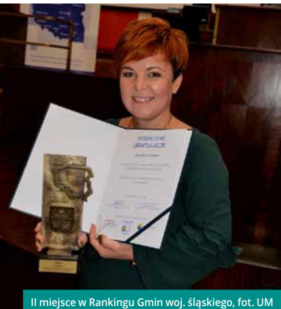
II miejsce w Rankingu Gmin woj. śląskiego

Lubimy czuć się doceniani, a każde wyróżnienie staje się nie tylko potwierdzeniem słuszności działań, ale również kolejną motywacją do działania i dalszej efektywnej pracy. Minione lata zaowocowały wieloma wyróżnieniami, których nie sposób wymienić w całości. Poniżej przypominamy więc kilka nich, jednocześnie dziękując Państwu za wspólną pracę i wsparcie, dzięki którym możemy tworzyć dobre rzeczy.