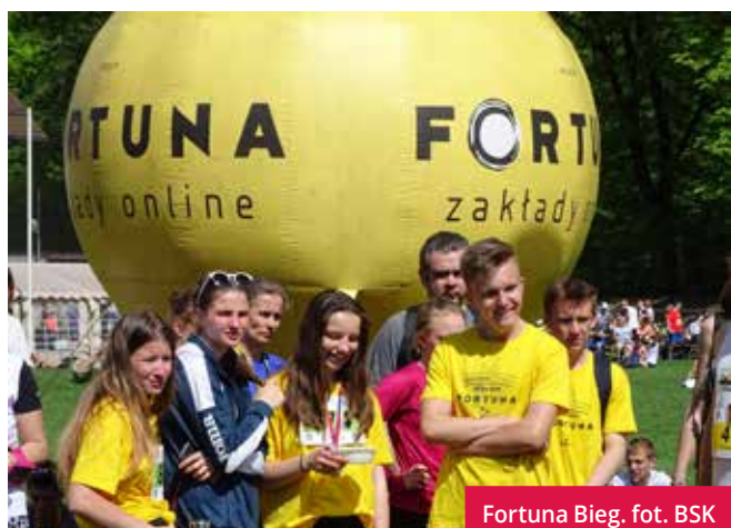
Fortuna Bieg.