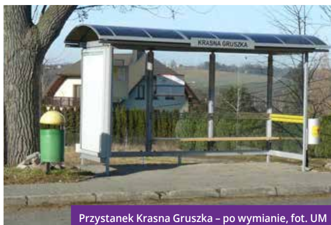
Przystanek Krasna Gruszka – po wymianie