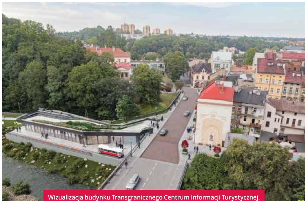
Wizualizacja budynku Transgranicznego Centrum Informacji Turystycznej.

Projekt przewiduje m.in. upamiętnienie trasy tramwaju, dawnych przystanków tramwajowych, wybudowanie transgranicznego centrum informacji turystycznej oraz wykonanie i wyeksponowanie repliki tramwaju cieszyńskiego. Wydane zostaną materiały promocyjne, przygotowane aplikacje, filmy i gry (w wersji analogowej i internetowej). Przygotowa-