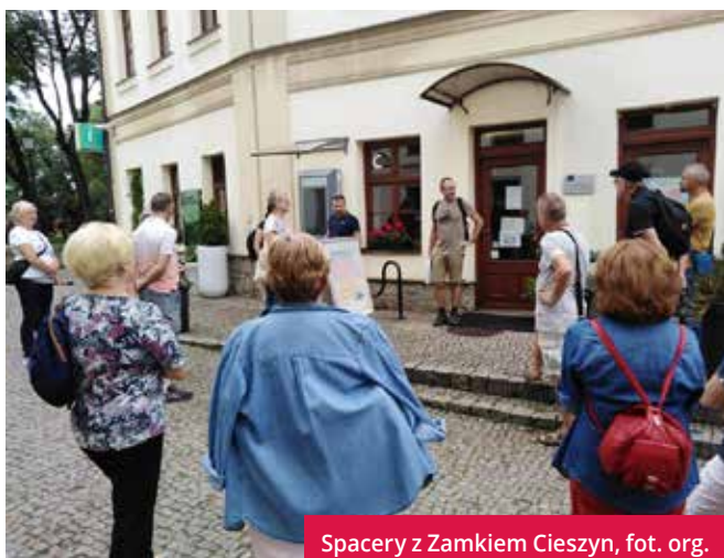
Spacery z Zamkiem Cieszyn