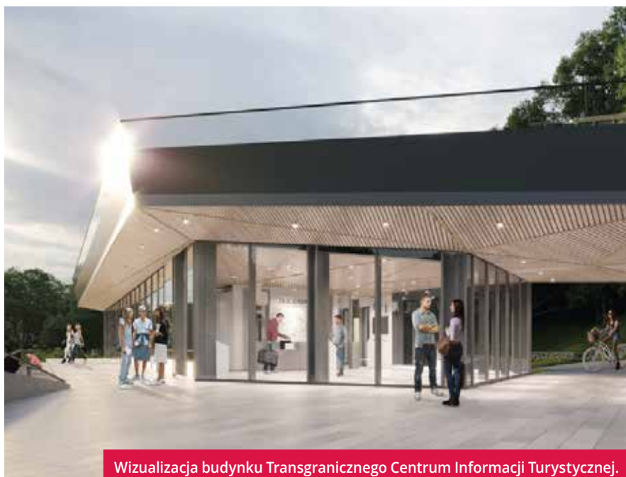
Wizualizacja budynku Transgranicznego Centrum Informacji Turystycznej.

Wydatki całkowite Miasta Cieszyn to 3 278 186,64 euro, w tym dofinansowanie z Europejskiego Funduszu Rozwoju Regionalnego: 1 485 548,17 euro. ●