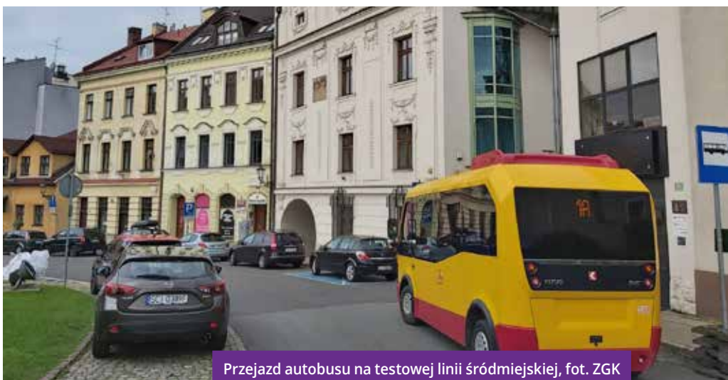
Przejazd autobusu na testowej linii śródmiejskiej