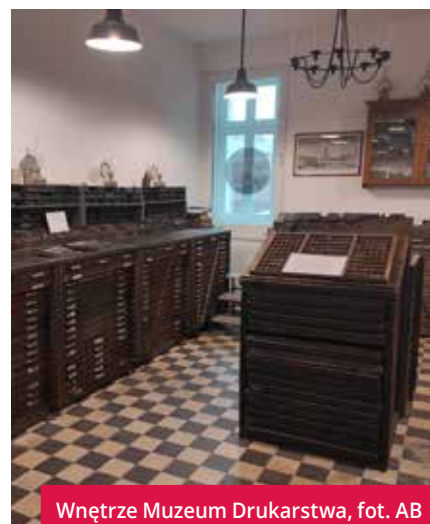
Wnętrze Muzeum Drukarstwa

Wartość projektu: 1 884 469,52 zł. Wkład Funduszy Europejskich: 1 100 849,21 zł. ♦