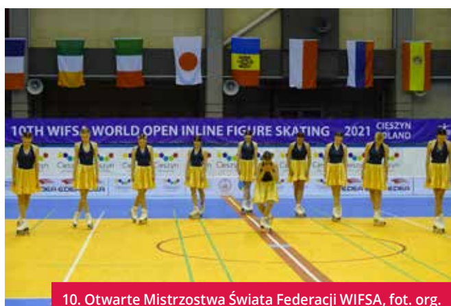
10. Otwarte Mistrzostwa Świata Federacji WIFSA, fot. org.

Cieszyn sportem stoi i już nieraz gościł znakomitych zawodników, zawodniczki i organizatorów rangi ogólnopolskiej, międzynarodowej, a nawet światowej. Współdziałał miasta w organizacji tego typu imprez sportowych zawsze stanowi wartość marketingową i świadczy o jego rozwoju oraz prestiżu.