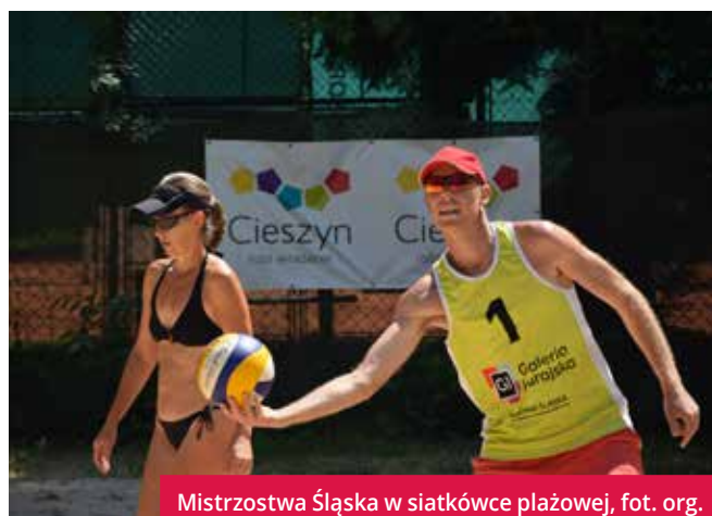
Mistrzostwa Śląska w siatkówce plażowej