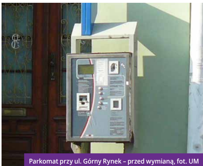
Parkomat przy ul. Górny Rynek – przed wymianą