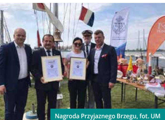
Nagroda Przyjaznego Brzegu

■ Miasto Cieszyn zajęło II miejsce w Rankingu Gmin województwa śląskiego w kategorii gmin powyżej 20 tys. mieszkańców. Ranking przygotowała Fundacja Rozwoju Demokracji Lokalnej im. Jerzego Regulskiego we współpracy z Głównym Urzędem Statystycznym.