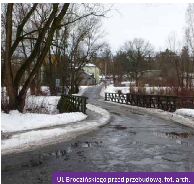
Ul. Brodzińskiego przed przebudową

Władze Cieszyna dokładają wszelkich starań, aby poprawić stan infrastruktury drogowej, poprzez realizację inwestycji w kolejnych latach. Przypomnijmy – zadania związane z utrzymaniem dróg na terenie Cieszyna realizuje Miejski Zarząd Dróg. MZD zarządza drogami gminnymi oraz powiatowymi na podstawie porozumienia zawartego z Powiatem Cieszyńskim w sprawie powierzenia przez Zarząd Powiatu Cieszyńskiego zadań zarządcy dróg powiatowych w granicach Cieszyna.