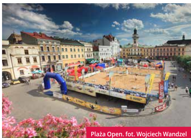
Plaża Open.