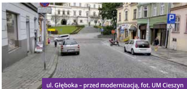
ul. Głęboka – przed modernizacją

Koszty całkowite modernizacji: 4 978 566,20 zł. Inwestycja została dofinansowana ze środków Unii Europejskiej oraz z Funduszu Dróg Samorządowych. ◆