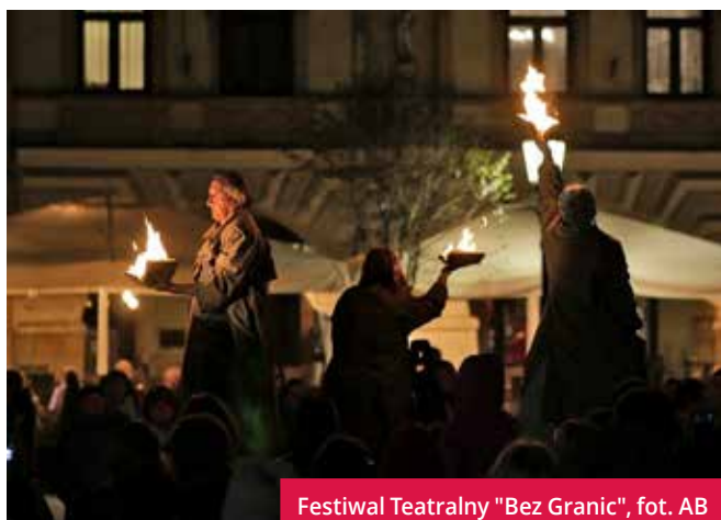
Festiwal Teatralny "Bez Granic"