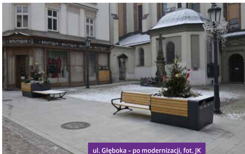
ul. Głęboka – po modernizacji, fot. JK